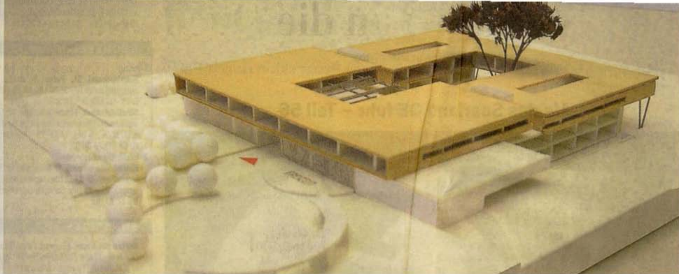
Das künftige Lyzeum wird über 50 Räume verfügen. Der Funktionsbereich umfasst 28 Zimmer.